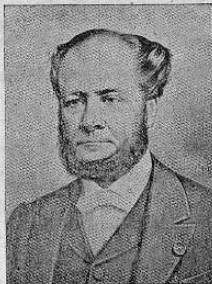
Doctor don JOSE MARIA CASTRO MADRIZ

sieron que nuestro país quedara atrás en el ritmo de liberación que se hacía sentir en el suelo americano, por lo cual propusieron al Presidente Castro que proclamara a Costa Rica como Nación Libre e Independiente, proyecto que fué acogido con todo entusiasmo y patriotismo por don José María y aprobado luego, el 30 de agosto de 1848, por el Supremo Congreso de la República. Aun resonaban en el ambiente nacional los disparos de la patrulla que fusilara al General Francisco Morazán y ya sus más caros sueños idealistas robaban fatalmente rotos por la autonomía que adquirirían los Estados de Centro América.